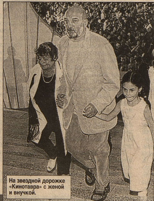
На звездной дорожке «Кинотавра» с женой и внучкой.

- Может, и так, но я самоед и первым делом всегда вспоминаю, что не удалось, не получилось. Вероятно, это не нужно афишировать, выносить на широкий суд, но я-то знаю: «блины» были разные. Удача, что одной из первых моих картин стала климовская «Агония». Меня словно на сверхзвуковом лайнере покатали. А потом приходилось и на «кукурузнике» болтаться, и в телеразвлекательном ползком пробираться. Впрочем, падения, провалы тоже по-своему полезны, они вразумляют, смиряют, не дают слишком заноситься. Все в моей жизни было, ни о чем не жалею, ни от чего не отказываюсь - нет, но... нужно и честь знать. Лучше уйти самому, чем ждать, пока захихикают за спиной. Не хочется позорить профессию, которая всю жизнь меня кормила - сначала худо-