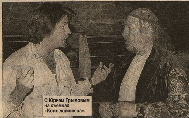
С Юрием Грыммовым на съемках «Коллекционера».

тему, однако уверен: Васильева действует с благословения духовника. Наверное, у нее хватает энергии на все - и на церковь, и на лицедейство, а мне приходится чем-то жертвовать.