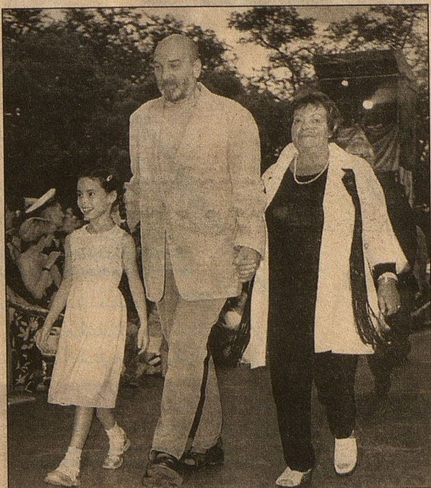
■ С женой и внучкой на кинофестивале «Кинотавр»

Когда мы встречаемся, это всегда большое счастье. Мы беседуем, вместе поем украинские песни (мой дед и бабка тоже из Украины). Одна из любимых – «Распрягайте, хлопцы, коней!».