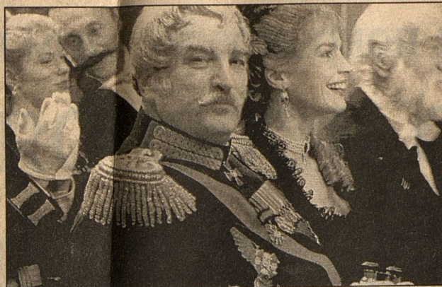
■ С Джулией Ормонд (кадр из фильма «Сибирский цирюльник»)

Рассказать о юбиларе «Антенна» попросила его близких, друзей и коллег.