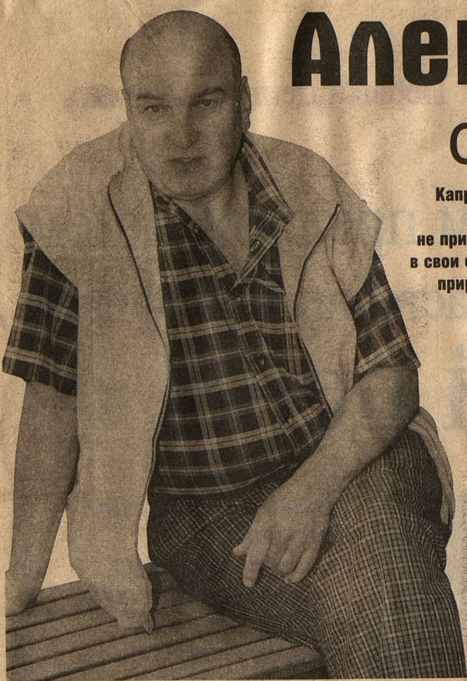
■ ЮБИЛАР: начал кинокарьеру с вырезанного эпизода

■ родился: 26 марта 1938 года в селе Чемер Черниговской области, Украина ■ образование: в 1961 году окончил Харьковский театральный институт ■ работа в театре: играл в театрах Запорожья и Донецка; с 1964 года – актер питерского Театра им. Ленсовета; с 1977 года играет в московских театрах (Театр на Малой Бронной, МХАТ, «Школа драматического искусства», «Школа современной пьесы») ■ кинокарьера: «Агония» (1974), «Сказ про то, как царь Петр арапа женил» (1976), «Женитьба» (1977), «Жестокий романс» (1984), «Коллекционер» (2001) и др. ■ семейное положение: женат ■ звание: народный артист РСФСР (1988)