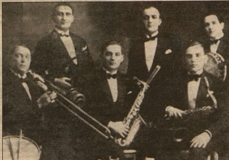
Знаменитый оркестр Ежи Петербургского («король танго» - второй справа в верхнем ряду)