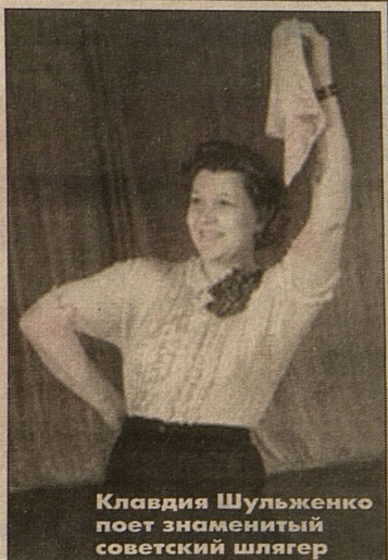
Клавдия Шульженко поэт знаменитый советский шлягер

На следующий день, 12 апреля 1942 года, на концерте в железнодорожном депо Волхова