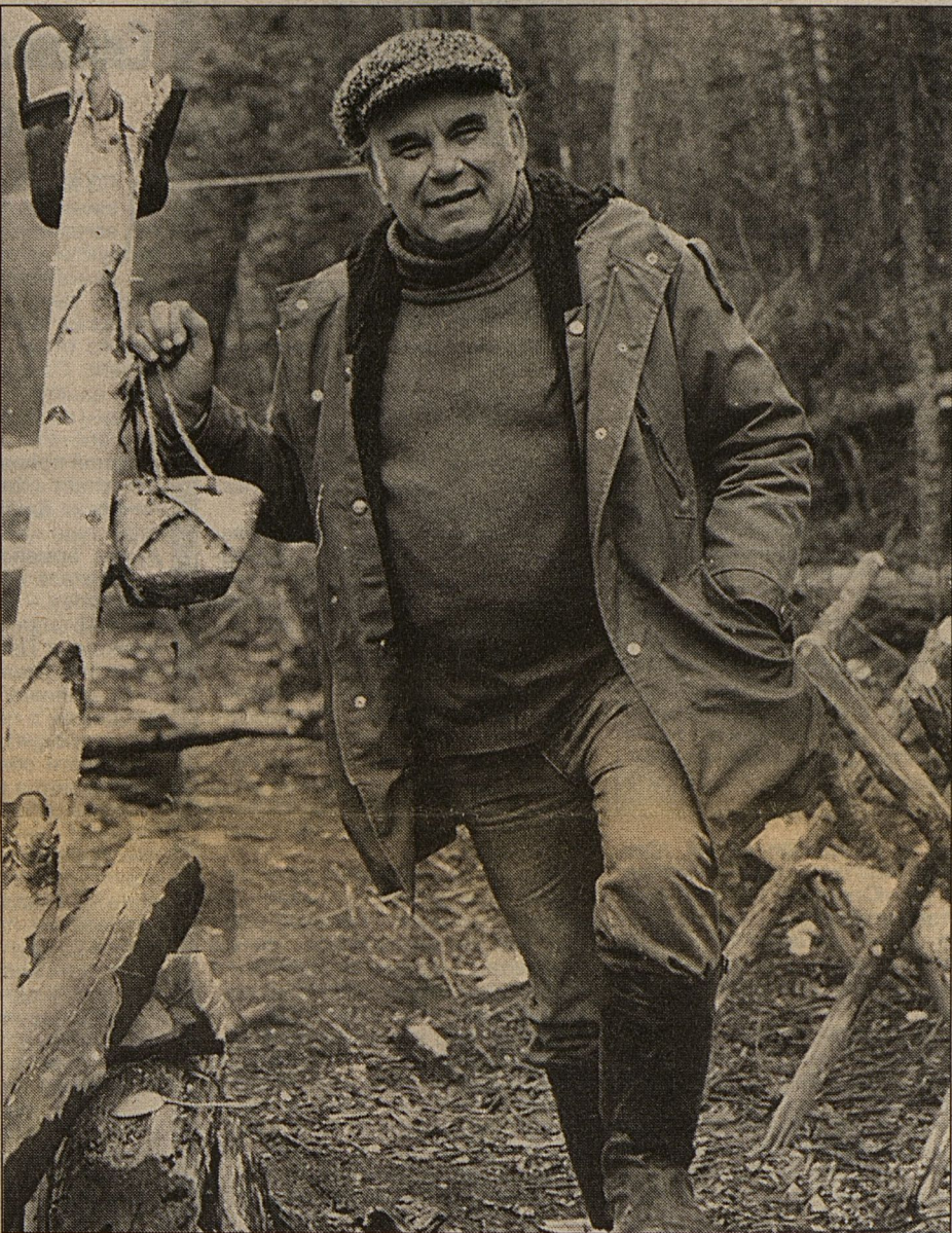
В красноярской тайге.

- Выходит, так. Позже, когда я стал поопытнее, мне предлагали писать в самые разные газеты, звали на хорошие должности на телевидение, предлагали стать главным редактором журналов «Турист», «Вокруг света», но я от всего