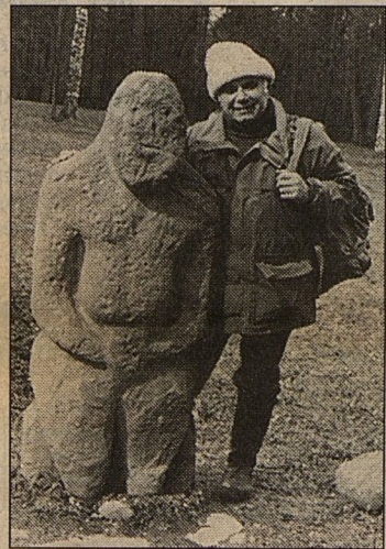
На Аляске в любом доме можно увидеть стреляющий арсенал, а вместо пойманной рыбы увезти с собой ее муляж, весящий триста граммов. Третий снимок сделан в нашей южной степи.