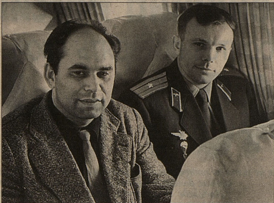
15 апреля 1961 года. Возвращение в Москву после полета Гагарина.

Я стал периодически бывать в доме Жукова, и наши встречи приняли более неформальный характер. Кстати, мы уже говорили сегодня о подарках, кото-