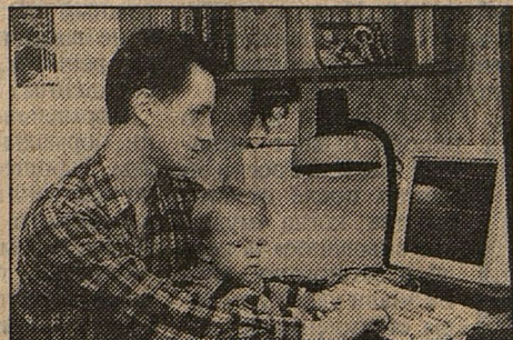
Ник Перумов с сыном работают на благо российского фэнтези.

Меня спрашивают, почему я не выступил против того, что русские мальчики гибнут на чеченской войне. Я всегда отвечаю - государство, начавшее войну, должно воевать, а не ду-