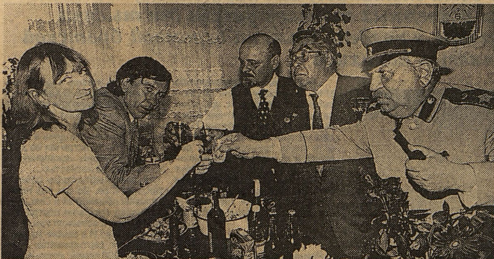
Вожди поздравили молодых.