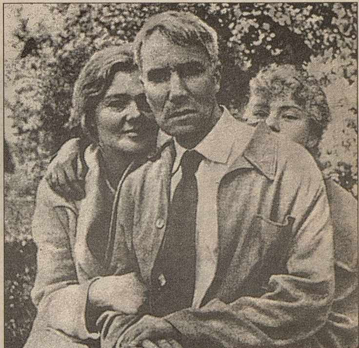
Их снова и снова бросало друг к другу...