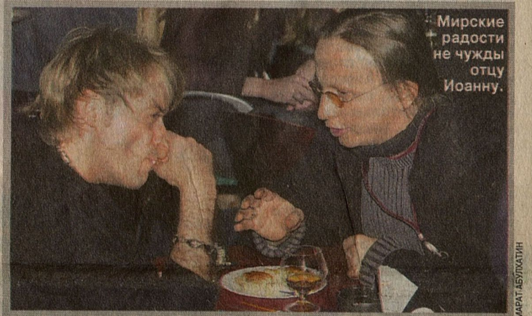
Мирские радости не чужды отцу Иоанну.