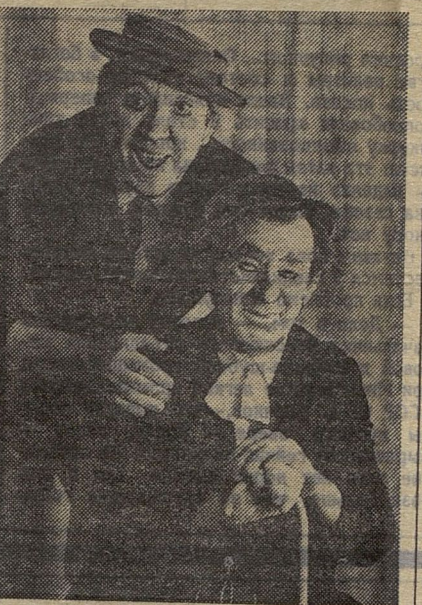
● Ю. Никулин и М. Шуйдин — дуэт наших ведущих клоунов.