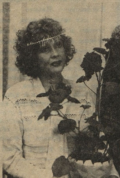
«Аэлита, не приставай к мужчинам».

— Как вы оцениваете настоящее положение в кино?