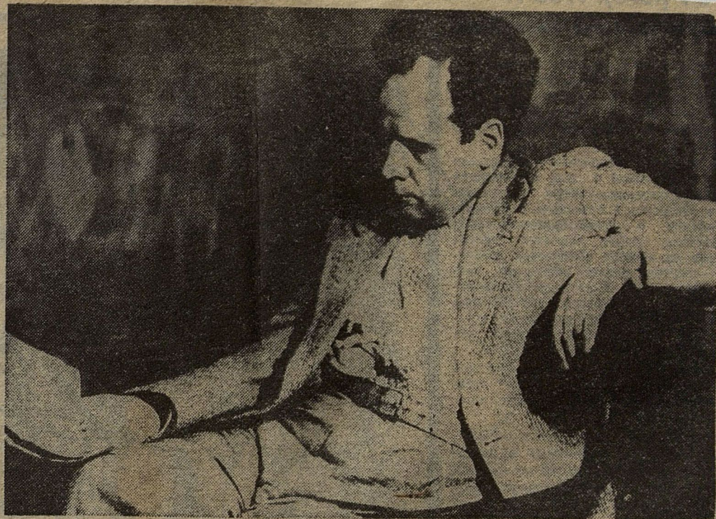
● С. М. ЭЙЗЕНШТЕЙН.