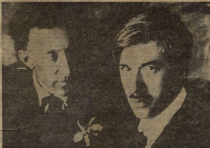
● А. А. БЛОК и К. И. ЧУКОВСКИЙ

Издательство «Планета» выпустило альбом, в который вошло более ста избранных фотографий известного советского портретиста М. Наппельбаума. За свою долгую творческую жизнь мастер сделал сотни портретов известных советских ученых, политиков, деятелей искусства и культуры, конструкторов и военачальников. И хотя почти все портреты сняты в фотоателье (тогда репортажная фотография делала свои первые шаги), благодаря большому искусству фотомастера все его работы представляют несомненный интерес и сегодня. Мы знакомим вас с некоторыми работами из коллекции мастера.