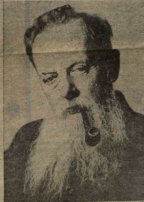
● П. П. БАЖОВ.