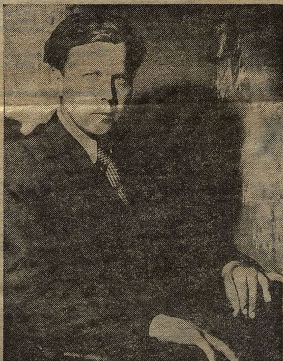
● А. Т. ТВАРДОВСКИЙ.