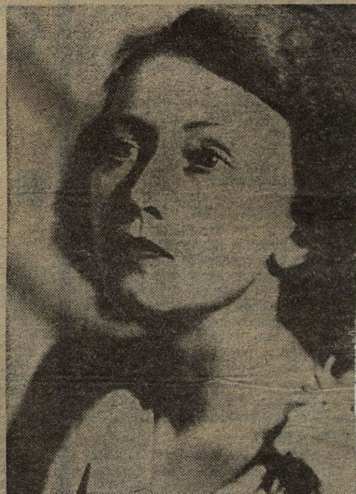
● Г. С. УЛАНОВА.

Издательство «Планета» выпустило альбом, в который вошло более ста избранных фотографий известного советского портретиста М. Наппельбаума. За свою долгую творческую жизнь мастер сделал сотни портретов известных советских ученых, политиков, деятелей искусства и культуры, конструкторов и военачальников. И хотя почти все портреты сняты в фотоателье (тогда репортажная фотография делала свои первые шаги), благодаря большому искусству фотомастера все его работы представляют несомненный интерес и сегодня. Мы знакомим вас с некоторыми работами из коллекции мастера.