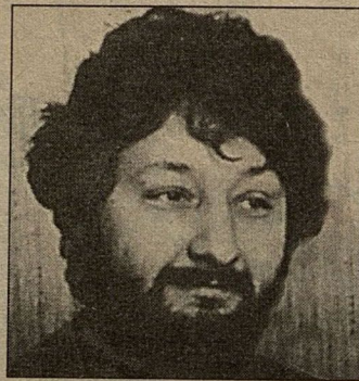
Стас Намин — это голова

Пока нет своего помещения, ставят в Театре Эстрады (первый показ — 16 ноября). Русский вариант — это не только перевод, но и привнесение наших, понятных нынешнему зрителю реалий. Действие перенесено из нью-йоркского парка в родной парк Горького, ну и так далее. Как много в этом