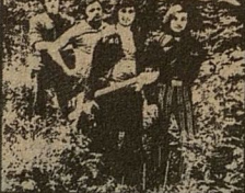
ГРУППА СТАСА НАМИНА

— Стас Намин явно не из тех, кто готов всю жизнь пожинать прежние лавры. Создатель первой отечественной супергруппы «Цветы», собственного радиоканала, телепрограммы и много чего еще, как всегда, полон новых идей.