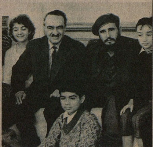
Карибский кризис сделал Анастаса Микояна и Фиделя Кастро близкими друзьями (середина 60-х)