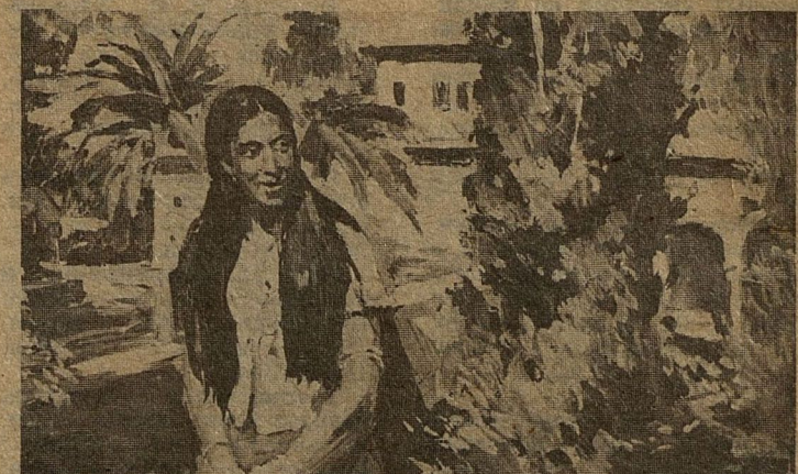
Нидерланды. Амстердам. — Испания. В Севилье.