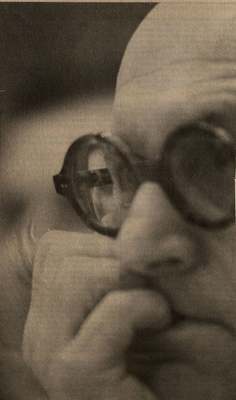
Майкл Найман давно и безуспешно пытается стряхнуть с себя ярлык композитора для фильмов Гринуэя