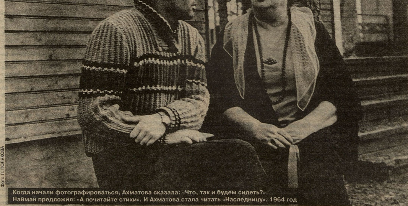
Когда начали фотографироваться, Ахматова сказала: «Что, так и будем сидеть?» Найман предложил: «А почитайте стихи». И Ахматова стала читать «Наследнику». 1964 год

Когда Найман вернулся в Москву, ему пришло письмо от сэра Исайи. Оказалось, это было самое последнее письмо, которое