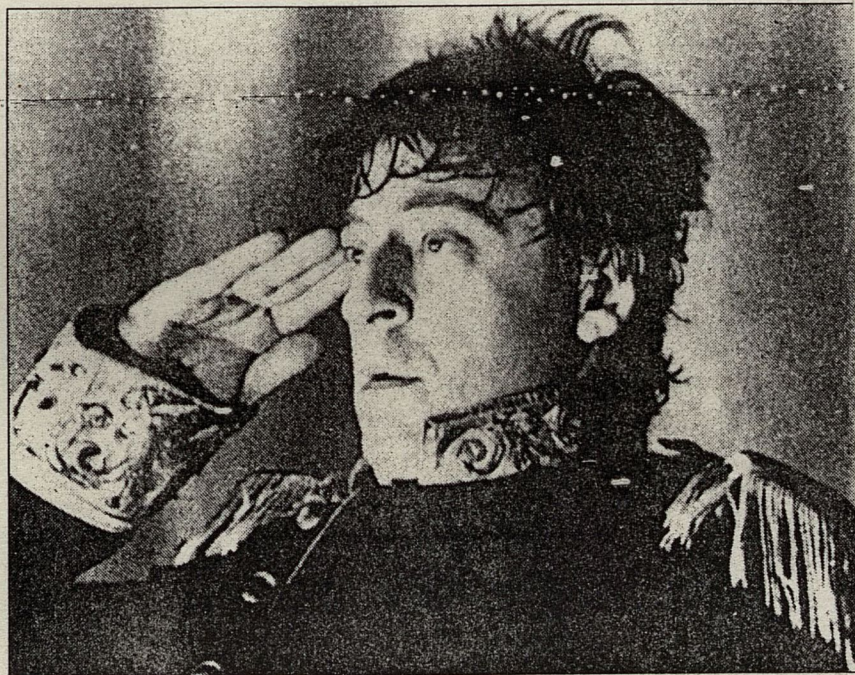
Геннадий Хазанов 10 лет назад, на сцене Театра эстрады.