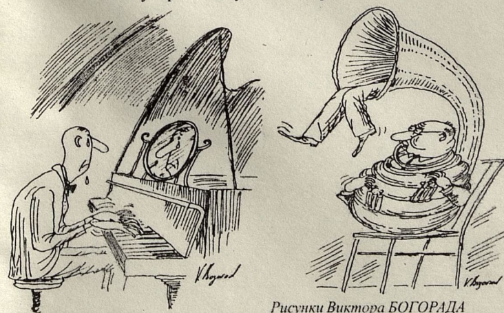
Рисунки Виктора БОГОРАДА