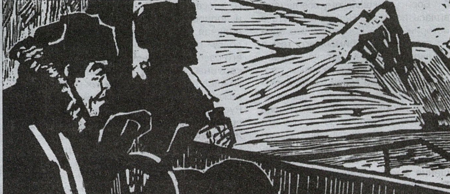
Г. Москалев. Утро. Из серии «Водники». Линогравюра. 1964