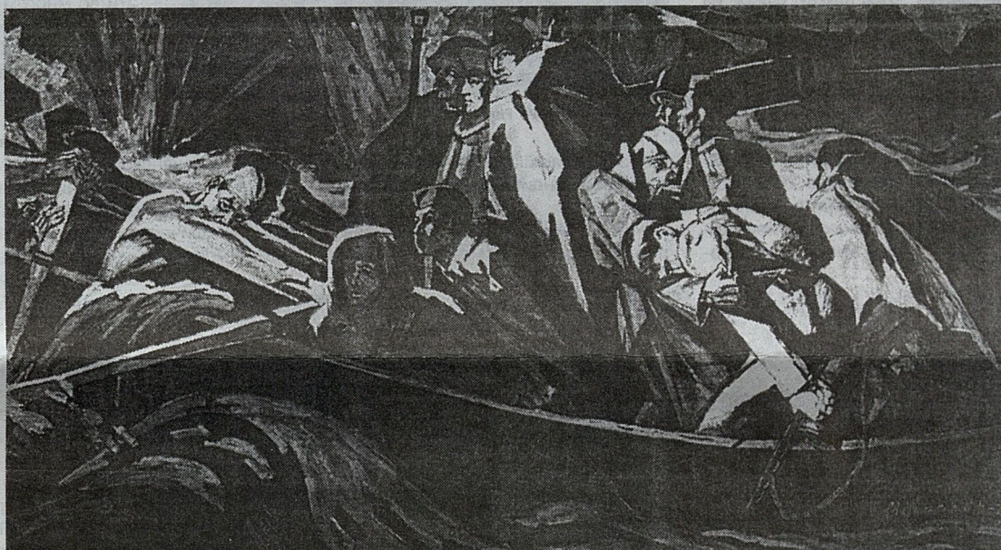
Г. Москалев. Битва за Дунай. Х., м. 1975