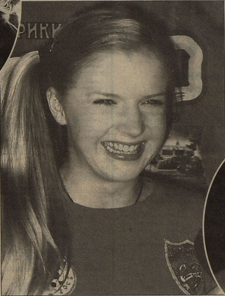
Михальчик снова смеется. Она предпочла неизвестного молодого красавца (на фото снизу) известному продюсеру Шульгину (на фото сверху)

ЭТА ИСТОРИЯ страстей достойна латиноамериканского сериала. Сначала бедная певица Валерия сбежала от домашнего тирана, известного продюсера Александра Шульгина. Миллионы российских женщин принялись жалеть несчастную певицу, вынужденную после роскошной жизни в Москве, поселиться затворницей вместе с тремя детьми в глуши Саратовской области. Но на защиту несчастной униженной женщины встал добрый лысый молодец - другой известный продюсер Иосиф Пригожин. Он так проникся страданиями Валерии и так влюбился в ее красоту,