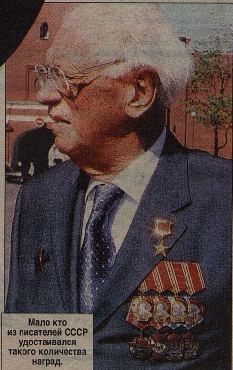
Мало кто из писателей СССР удостоивался такого количества наград.