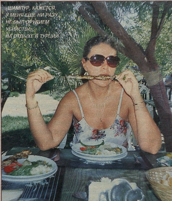
ШАМПУР, КАЖЕТСЯ, У МЕНЯ ЕЩЕ НИ РАЗУ НЕ БЫЛ ОРУДИЕМ УБИЙСТВА... НА ОТДЫХЕ В ТУРЦИИ