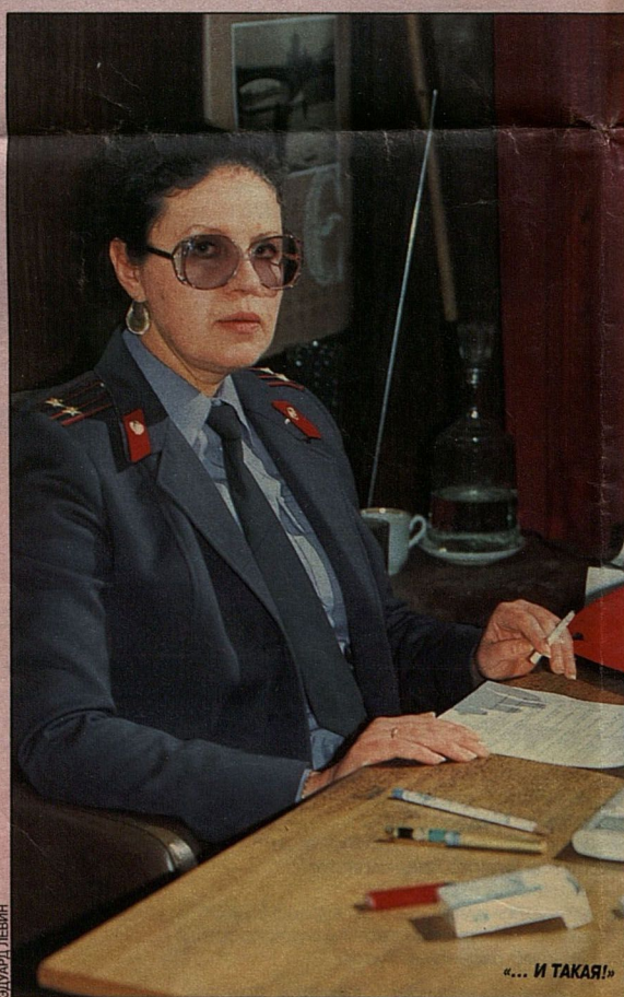
«... И ТАКАЯ!»

— Вообще-то я готовила себя к карьере кинорежиссера, лелея надежду поступить во ВГИК. Но