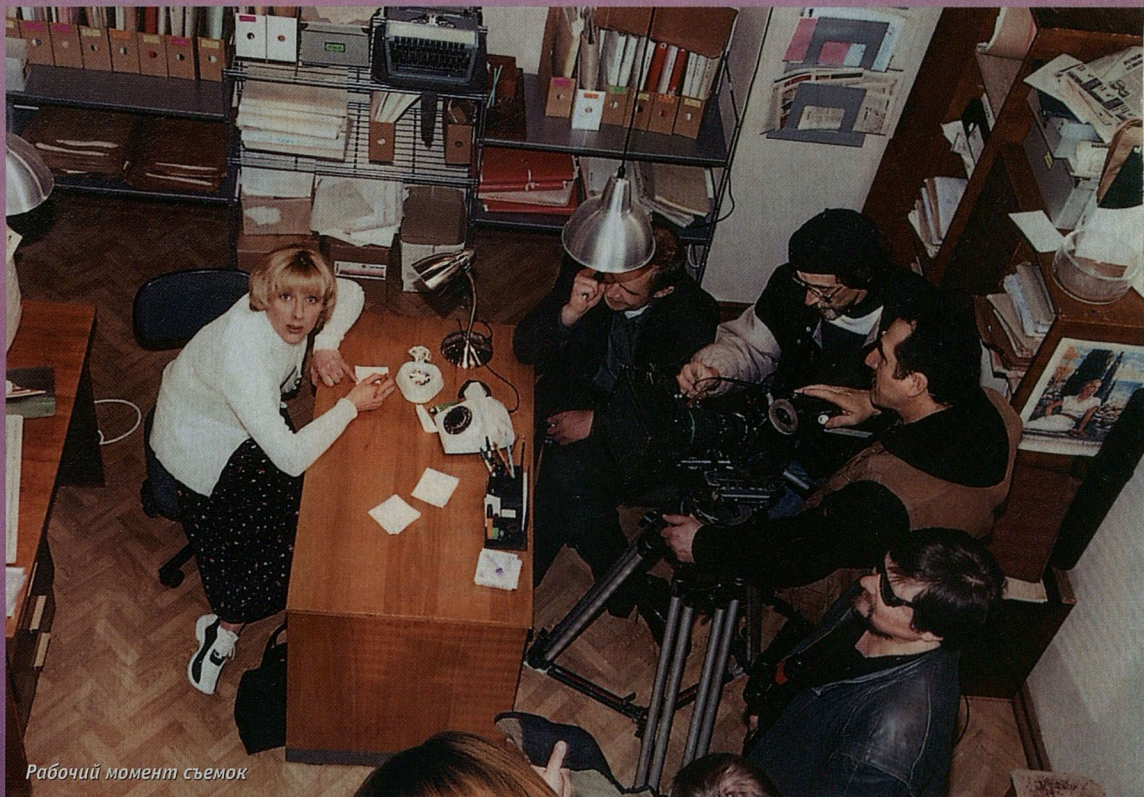
Рабочий момент съемок

Съемочную группу сериала «Каменская» и писательницу Александру Маринину связывают особые отношения — уважительные, дружеские, теплые. Да это и понятно. На телеэкран выходит сериал «Каменская-2», а его создатели уже думают о будущем: весной Марина Анатольевна Алексеева, работающая под псевдонимом Александра Маринина, передала ВГТРК права на экранизацию еще четырех книг.