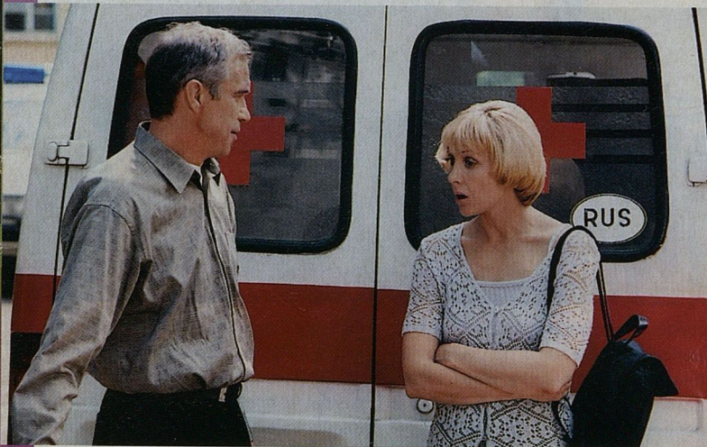
▲ Юрий Коротков (Сергей Гармаш) и Анастасия Каменская (Елена Яковлева)

свое, Настя Каменская взрослеет. Что же происходит с ней?