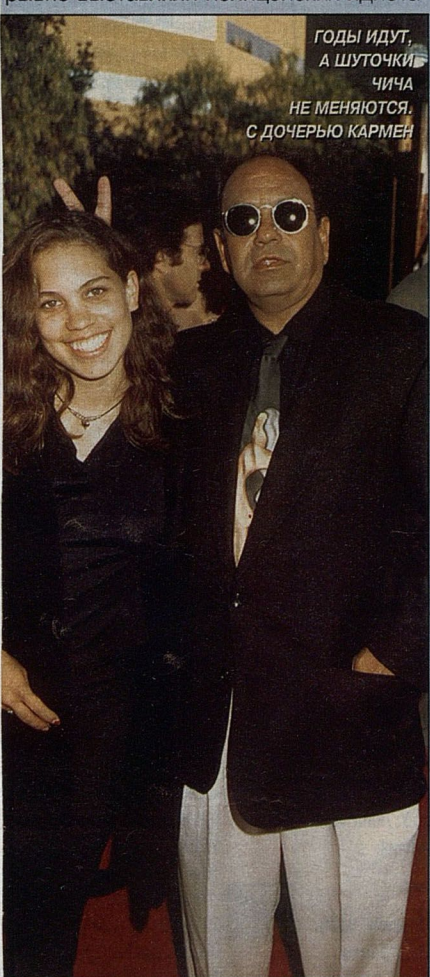
ГОДЫ ИДУТ, А ШУТОЧКИ ЧИЧА НЕ МЕНЯЮТСЯ. С ДОЧЕРЬЮ КАРМЕН

Все они (как и комические музыкальные шоу) были, собственно, об одном и том же — ни о чем. Чич и Чонг оказались некими прообразами Бивиса и Бат-Хеда, но если вторые бесконечно озабочены сексом, первые были сдвинуты на марихуане. К тому же Марин и Чонг весело и зло отыгрывали свое не слишком англосаксонское происхождение. И беспрерывно выставляли полицейских идиота-