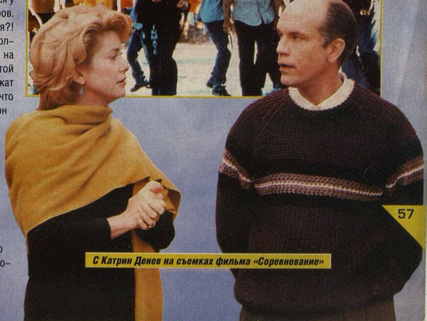
С Катрин Денев на съемках фильма «Соревнование»