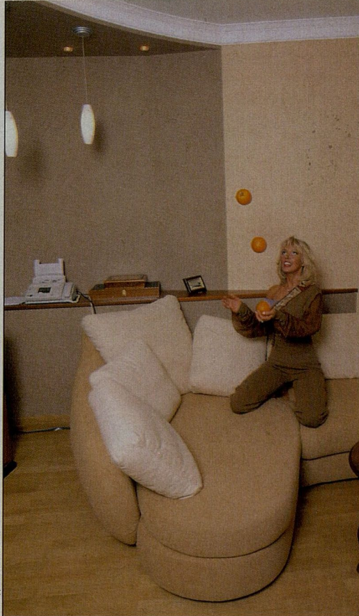
Совсем недавно ведущая “10 sexy” научилась жонглировать. Правда, проделывает она это только с апельсинами, с сырыми яйцами еще опасается.