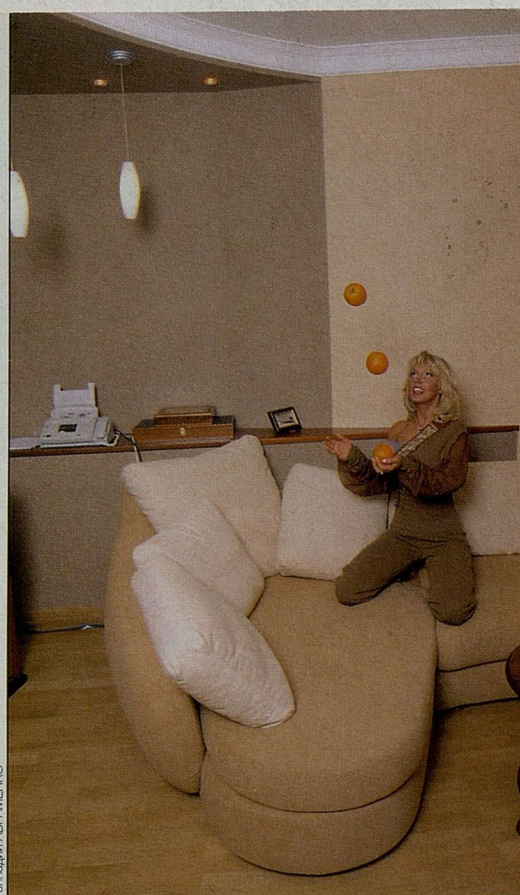
Совсем недавно ведущая “10 sexy” научилась жонглировать. Правда, проделывает она это только с апельсинами, с сырыми яйцами еще опасается.