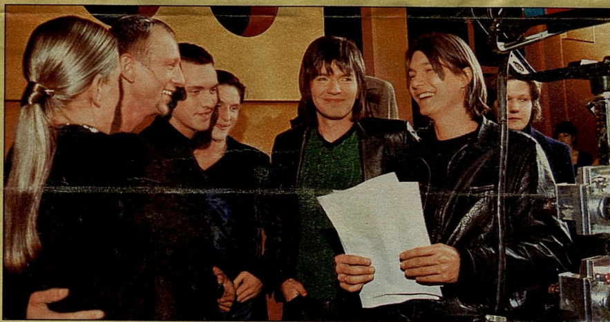
Певец, режиссер и съемочная группа

На днях Дмитрий Маликов снял свой очередной клип, посредством которого он решил попрощаться с этим столетием, уходящим в небытие через пару месяцев. Название песни, на которую снимался ролик, звучит как призыв: «Отпусти XX век». К тому же певец уверяет, что не стоит тащить за собой в будущее казусы и неурядицы прошлого, о чем, собственно, и поет.