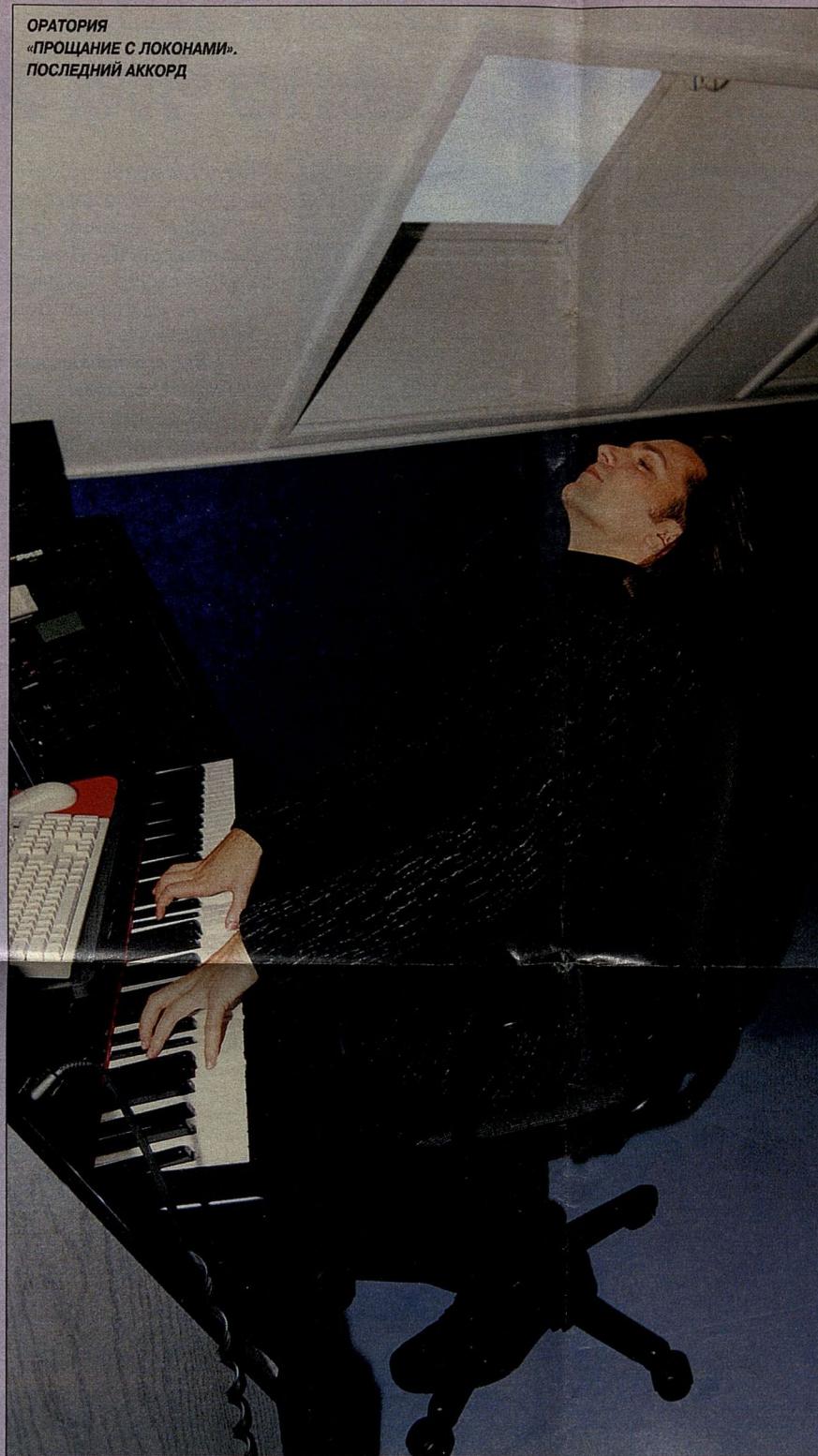
ОРАТОРИЯ «ПРОЩАНИЕ С ЛОКОНАМИ». ПОСЛЕДНИЙ АККОРД

ные приборы, чайники, самовары. Но у нас же любят, не разобравшись, вешать обидные обвинения. А их в мой адрес было столько! Два года у меня ушло на восстановление студии. Теперь я защищен. У меня много огнетушителей, очень качественная проводка. Слава Богу, что мне помогли. Один бы я это не потянул. Но есть люди, которые ценят меня, знают, что я человек доброжелательный, но вместе с тем независимый. Я веду достаточно обособленный образ жизни.