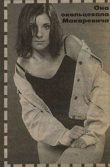
Она окольцевала Макаревича

Михаил САДЧИКОВ