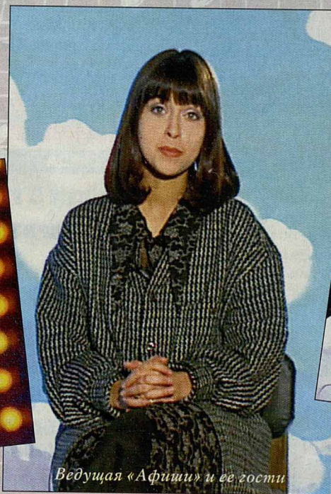
Ведущая «Афиши» и ее гости