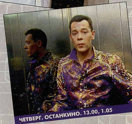
ЧЕТВЕРГ. ОСТАНКИНО. 13.00, 1.05

О чень часто нам не хватает информации о тех или иных музыкальных событиях. И о концертах любимых групп узнаем мы после того, как они уже прошли. Если вообще узнаём. Чтобы таких неприятностей не случалось, существует программа «Афиша». На экране она уже давно. Но с приходом новых людей поднялась на совершенно иной профессиональный уровень. И, конечно, не в последнюю очередь это заслуга постоянной ведущей