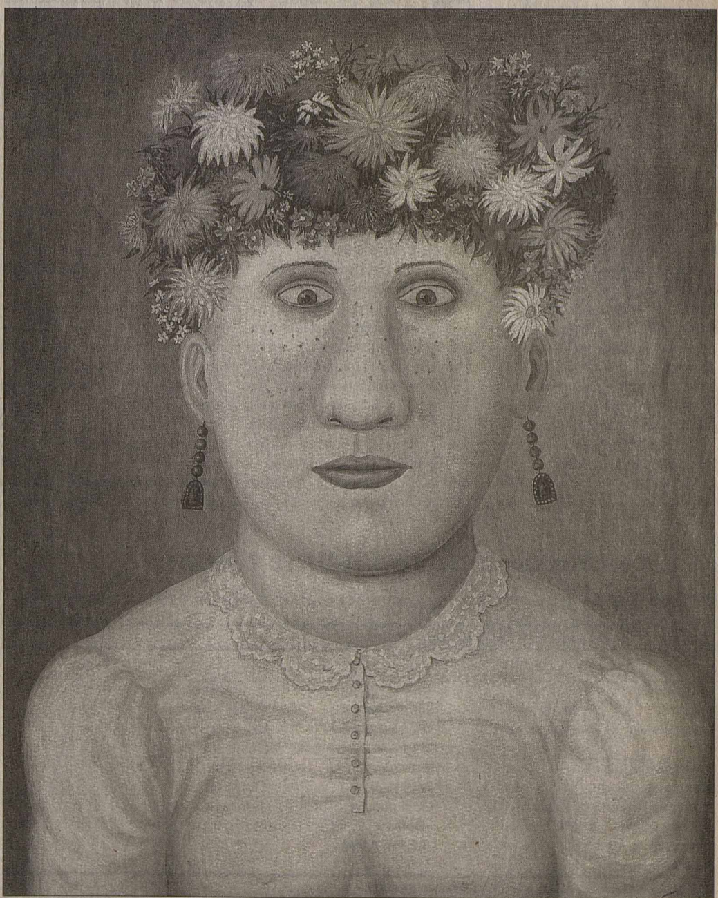
На женщине держится русская деревня.

– Я на телевидении в прямом эфире был, и меня спросила ведущая: «Ну что вы можете про перемиловцев сказать – трудолюбивые они или с ленцой?» А там надо отвечать очень быстро. Я сказал: «Трудолюбивые и с ленцой». Потом уже я подумал и понял, что это точная оценка. Философии там внутри нет никакой. Это менталитет. Не думаю, что они не делают чего-то осмысленно. Правда, в деревне есть и чудачки, юродивые, которые начинают баламутить народ, что-то изобретать, какую-нибудь электростанцию строить – раньше, конечно. И таких людей деревня, как правило, не понимает. А мне стало спокойнее жить, ког-