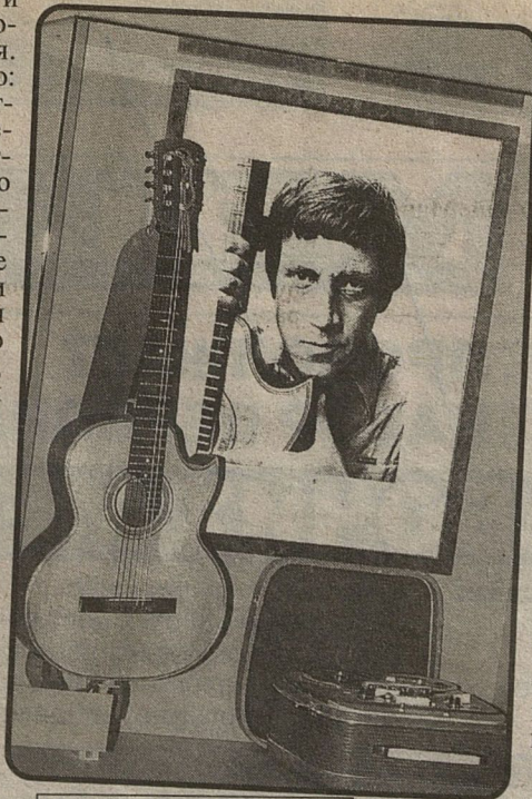
В музее В. Высоцкого.

Плаха из «Пугачева». Костюм Керенского из спектакля «10 дней, которые потрясли мир»... Здесь же - хорошо знакомый по фильму пиджак Жеглова с бутафорской Красной Звездой на лацкане.