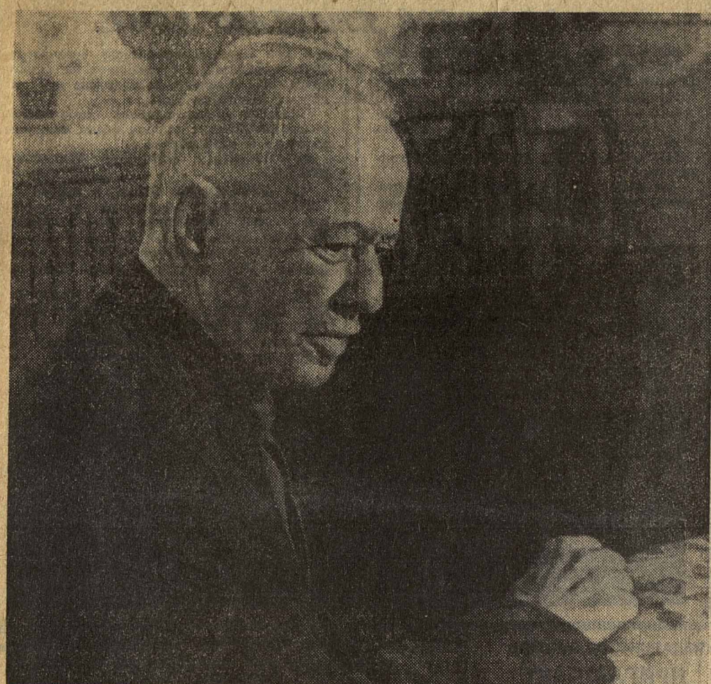
Михаил Александрович ШОЛОХОВ.