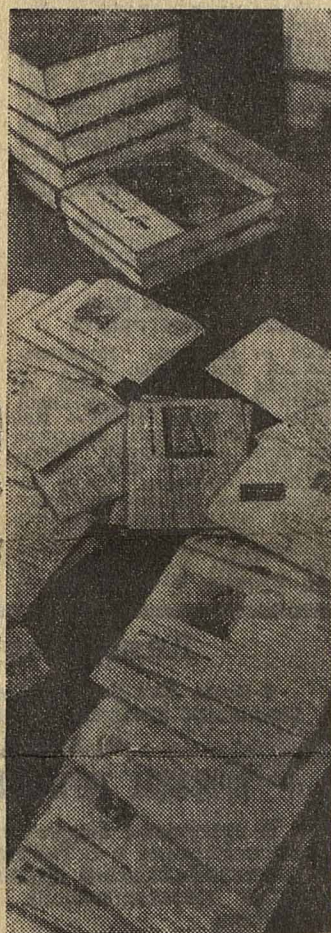
Десяти писем со всех концов страны и из-за рубежа ежедневно ложатся на рабочий стол писателя.

Вспоминается письмо военного корреспондента Шолохова, написанное в 1943 году и адресованное американским друзьям: