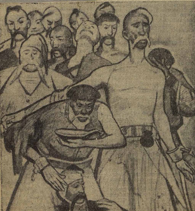
Иллюстрация художника Г. Е. ХОМАЗА к поэме «Гамалия».

Поэтому он жив поныне И вечно будет с нами жить. Принадлежавший Украине, Он нынче всем принадлежит!