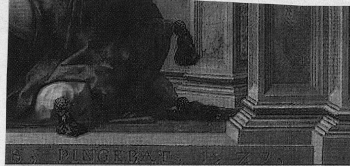
Госсарт. Даная. 1527 г.

движение истории: например, старуха Марианна или хорек. В третьих, персонажи светской хроники — барон фон Майзель, политик Луговой, финансист Левкоев, культуролог Роза Кранц. И, наконец, реальные исторические лица — скажем, Брандт или Блэр, или Ельцин с Путиным, или Франко. Внима-