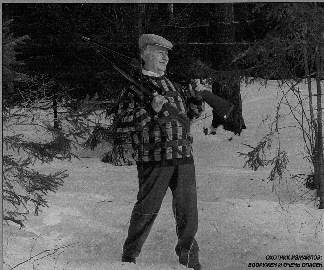
ОХОТНИК ИЗМАЙЛОВ: ВООРУЖЕН И ОЧЕНЬ ОПАСЕН

«Цель номер три... Кладу дуплетом», — разнеслось над заснеженной гладью подмосковного озера Круглое. И потом — бабах! — и радостный вопль: «Попал, попал!» Любители рыбалки сначала испуганно переглянулись, но потом побросали удочки и дружно двинули в ближний еловый лесок. Там они к своему удивлению обнаружили не браконьеров, а писателя-сатирика Лиона Измайлова с ружьем в руках, который и нарушал тишину и благолепие весеннего подмосковного утра.