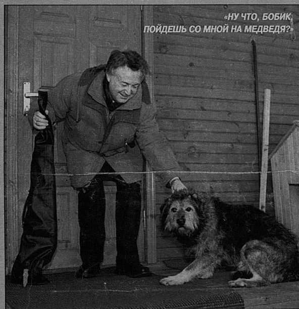
«НУ ЧТО, БОБИК, ПОЙДЕШЬ СО МНОЙ НА МЕДВЕДЯ?»

все с того, что десять лет назад Юрий Никулин решил купить ружье и предложил мне составить ему компанию. Мы обошли несколько магазинов, прежде чем нашли ему карабин. Попутно он и меня в охотники сагитировал. Потом Юрий Владимирович всегда, когда звонил мне, спрашивал разными голосами: «Это ружейный склад?» Моя жена не сразу к этому привыкла и все отвечала, что, мол, ошиблись телефоном. Вот тот ствол — ружье марки «Браунинг» — купил сам. Помню, продавец у меня спрашивает: «Вам на кого ружьишко: на медведя или кабанчика?» Я спокойно