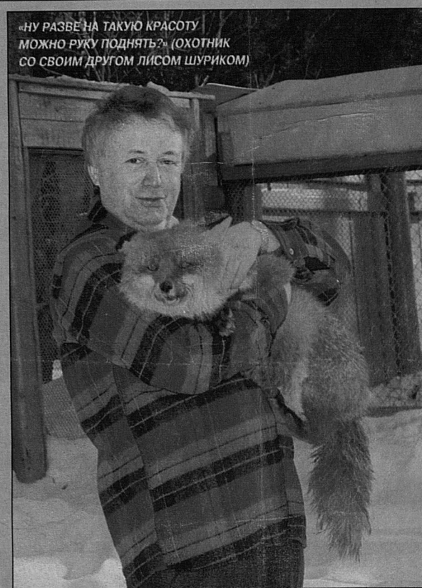
«НУ РАЗВЕ НА ТАКУЮ КРАСОТУ МОЖНО РУКУ ПОДНЯТЬ?» (ОХОТНИК СО СВОИМ ДРУГОМ ЛИСОМ ШУРИКОМ)

«Ну, хватит разговоров, пора к делу переходить», — решительно заявил сатирик, взял ружья, охотничью сумку и отправился в глубь леса, где за елями виднелась небольшая избушка. Неожиданно на встречу Измайлову из распахнутых ворот выскочила с лаем целая свора охотничьих собак. Они окружили писателя и... радостно начали его облизывать, признав старого знакомого. Но это было только начало! Откуда-то выскочила лиса и... запрыгнула на руки к Лиону. «Вот и трофей, — пошутил охотник и ласково погладил несостоявшийся воротник. — Здравствуй, Шурик, вижу, не забыл ты меня».