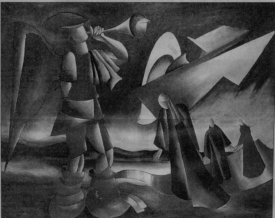
Е.Зевин. "Реквием по победе". 1992 г.