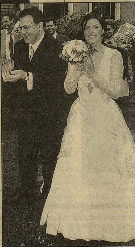
СВАДЬБА: жених солиден, невеста ослепительна

Бен Ладен возвращается домой и спрашивает жену: «Меня никто не искал?»