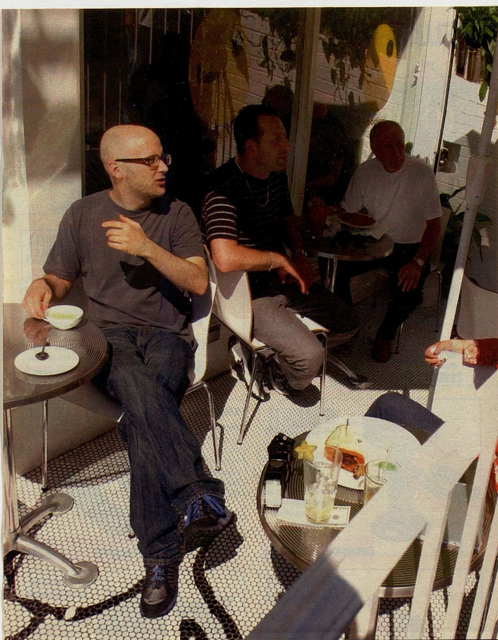
Моби в своем «чайном» ресторанчике «Teapу» в Нью-Йорке