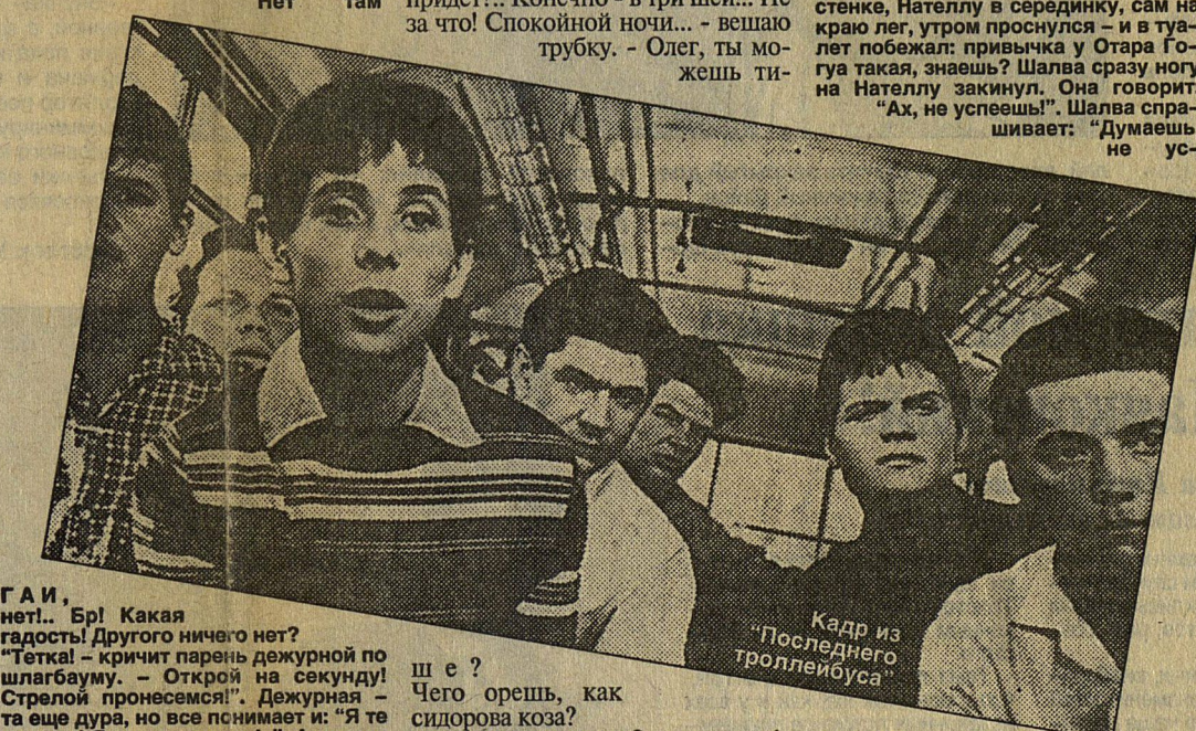
Кадр из "Последнего троллейбуса"