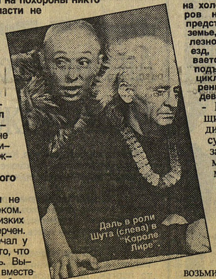
Даль в роли Шута (слева) в "Короле Лире".