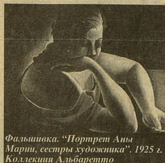
Фальшивка. «Портрет Аны Марии, сестры художника». 1925 г. Коллекция Альбаретто

ки испанского художника. И он мечет громы и молнии в адрес Альбаретто: «М.Бернардини, с которым я работал все эти годы, известный гравёр, имел большие проблемы в Германии, где делал по заказу Альбаретто копии с работ Дали, причем видоизмененные. Сейчас эти оттиски, числом четырнадцать, арестованы франкфуртской полицией».