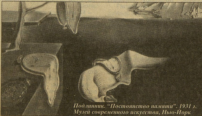
Подлинник. «Постоянство памяти». 1931 г. Музей современного искусства, Нью-Йорк