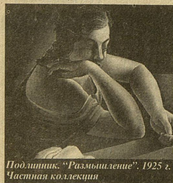
Подлинник. «Размышление», 1925 г. Частная коллекция