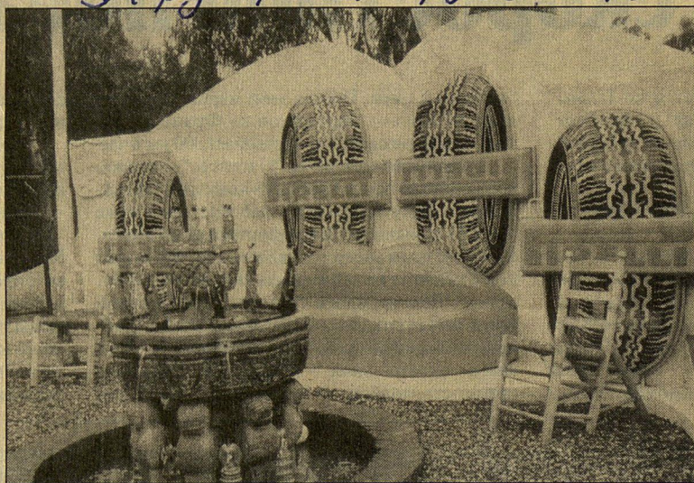
Экстравагантный двор в доме Дали в Порт Лигате — знаменитый диван с губами актрисы Мэй Уэст.

Пепе Жиро, работавший у Дали электромонтером, не растается с