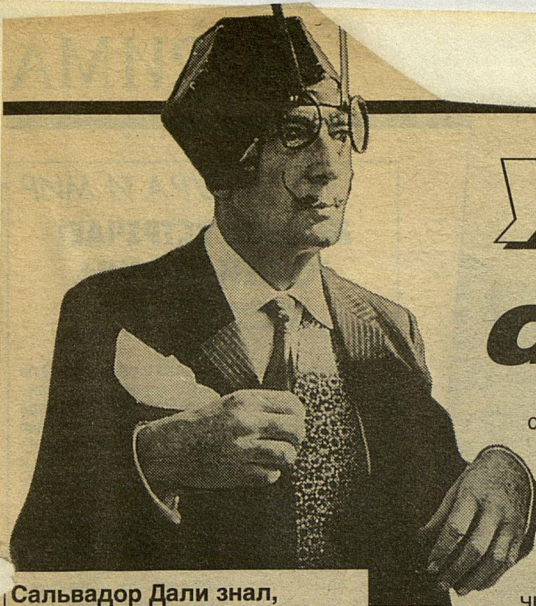
Сальвадор Дали знал, как потрясти воображение.