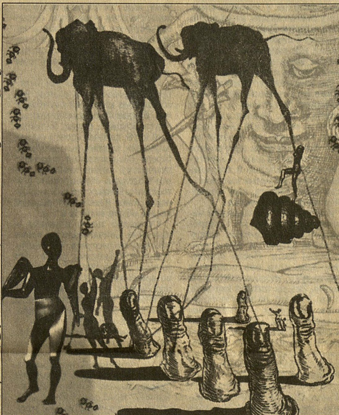
Слоны на тонких ножках, пальцы-фаллосы и прочие «визитные карточки» Дали представлены на выставке в разнообразных вариациях

Дали, как любой порядочный гений, был неописуемо плодот-