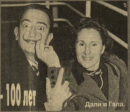
Дали и Гала.

А в 1929 году Дали встретит женщину, которая вскоре станет для него женой, любовницей, подругой, матерью, наставницей. Для Дали она божественная Гала, в то время как многие считали ее злой и жестокой, называя колдуньей. Елена Дьяконова, Гала Элюар, Гала Да-