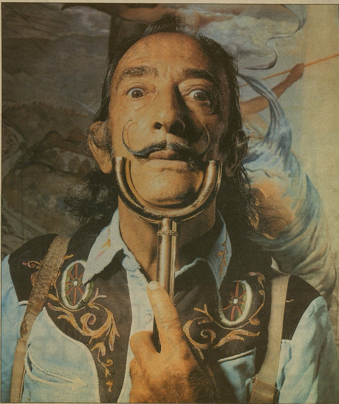
Момент познания истины