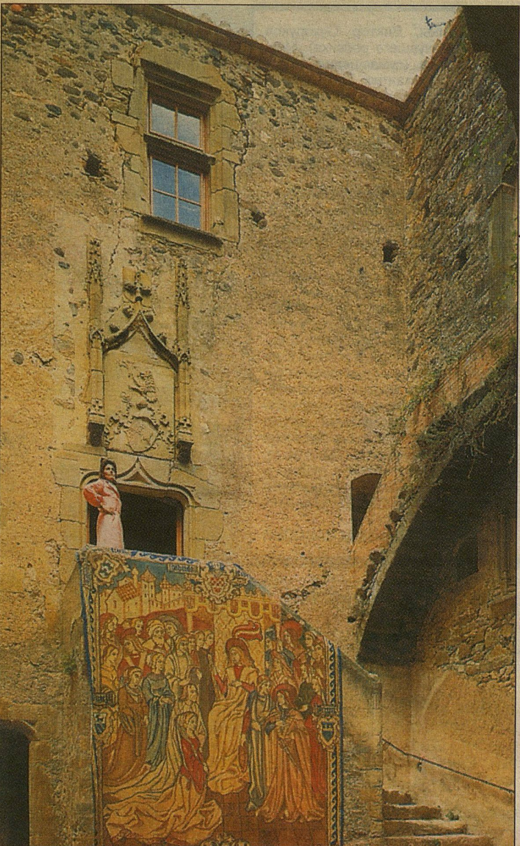
Развалины старого замка: подарок гения своей прекрасной даме