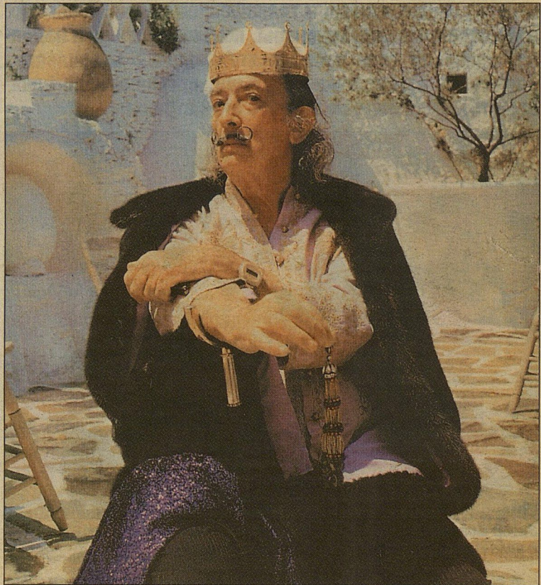
В роли Людовика, Короля-Солнца

Но мастерство фотографа раскрывается все-таки больше там, где Дали. Экспансивный человек с закрученными усами и характерным удлинненным лицом почти всегда в центре композиции: Дали в самодельной короне, Дали с расцветшим ухом (по аналогии с Ван Гогом – только у Дали вместо уха не кровавое месиво, а чудесный куст белых гардений), голый Дали в бассейне в момент познания истины... В «Алхимическом цикле» – религиозные причуды великого сюрреалиста: однажды возле его дома убирали мусор, и он попросил свалить все отходы производства ему в сад,