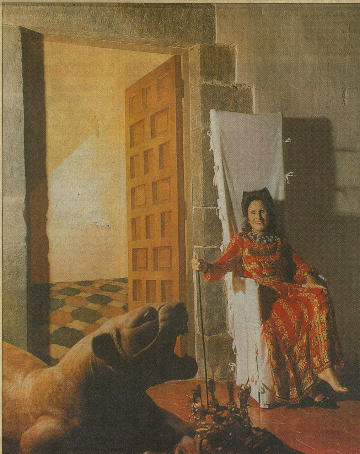
Галя в своем замке. Эта дверь не настоящая, а нарисованная