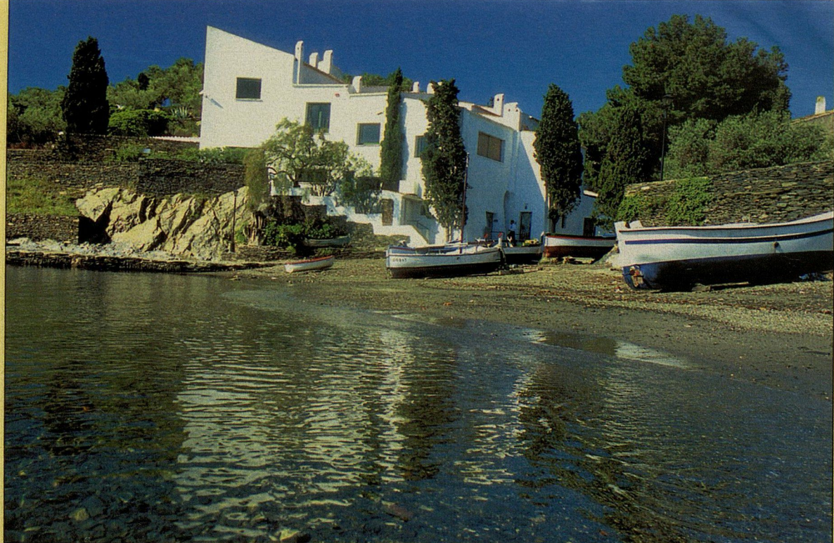
Дали и Галя начали строить свой дом в Порт-Лигате еще в 1932 году

лосами, и все мужчины на пляже беззастенчиво рассматривали ее фигуру... Через пару дней он увел Гала гулять к скалам и, когда они взобрались на утес, дрожа от волнения, спросил: «Что вы хотите, чтобы я с вами сейчас сделал?» Галя медленно окинула взглядом бухту. Вид на море захватывал дух. Она пристально посмотрела ему в глаза и прошептала: «Я хочу, чтобы вы меня взорвали!» Каталонские скалы стали первыми свидетелями этой безумной страсти. Август закончился, гости уехали, а Галя осталась.