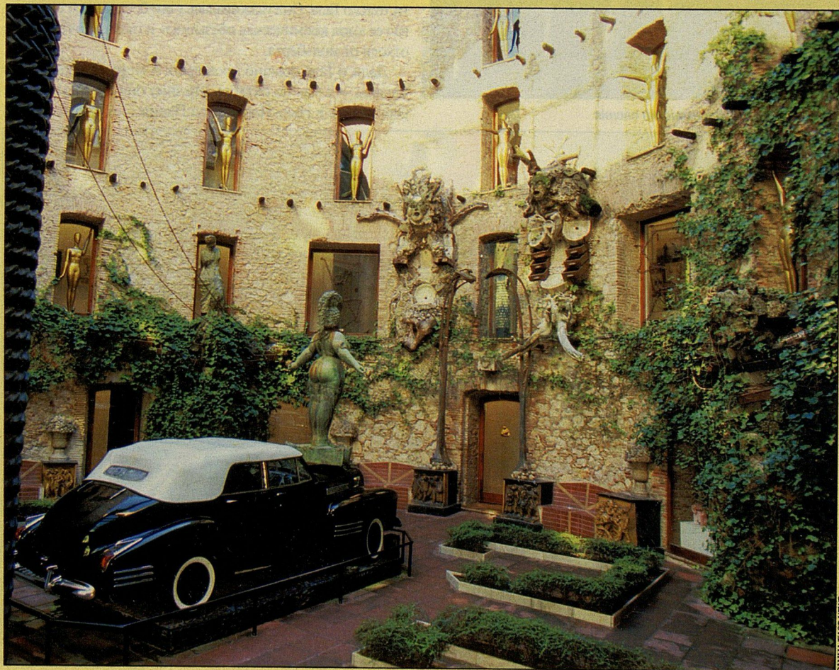
Музей-театр Дали. В центре внутреннего двора — любимый «Кадиллак» маэстро