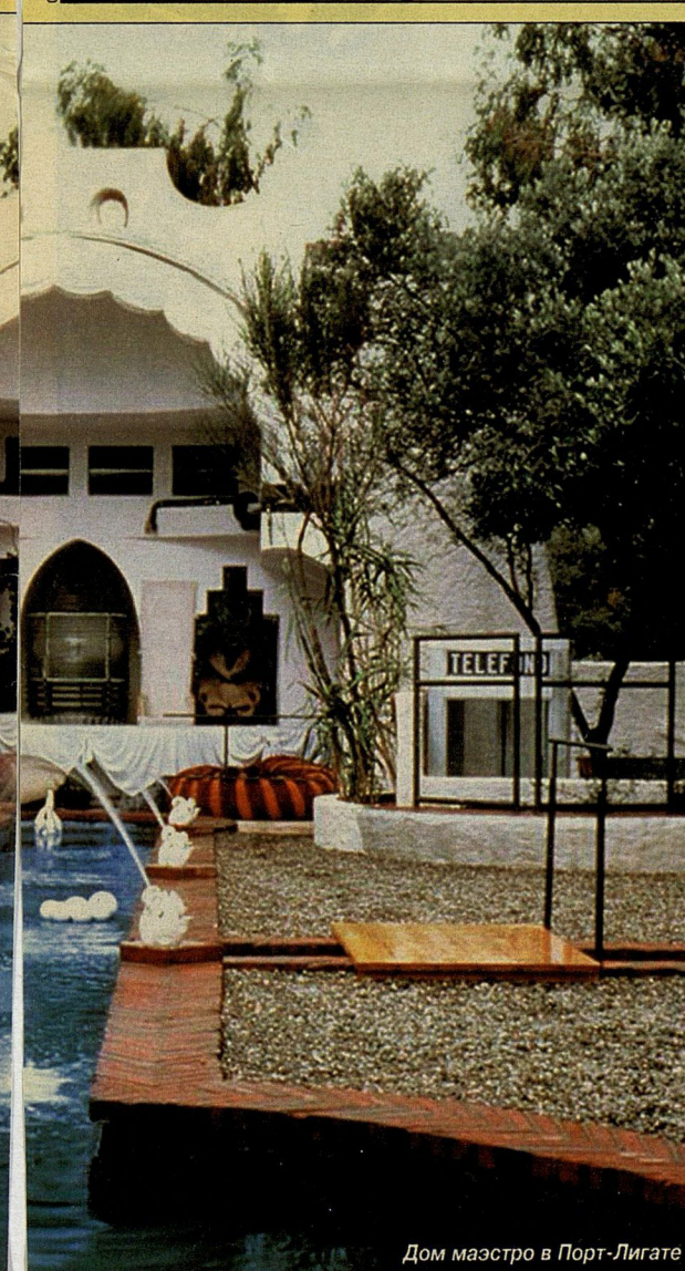
Дом маэстро в Порт-Лигате