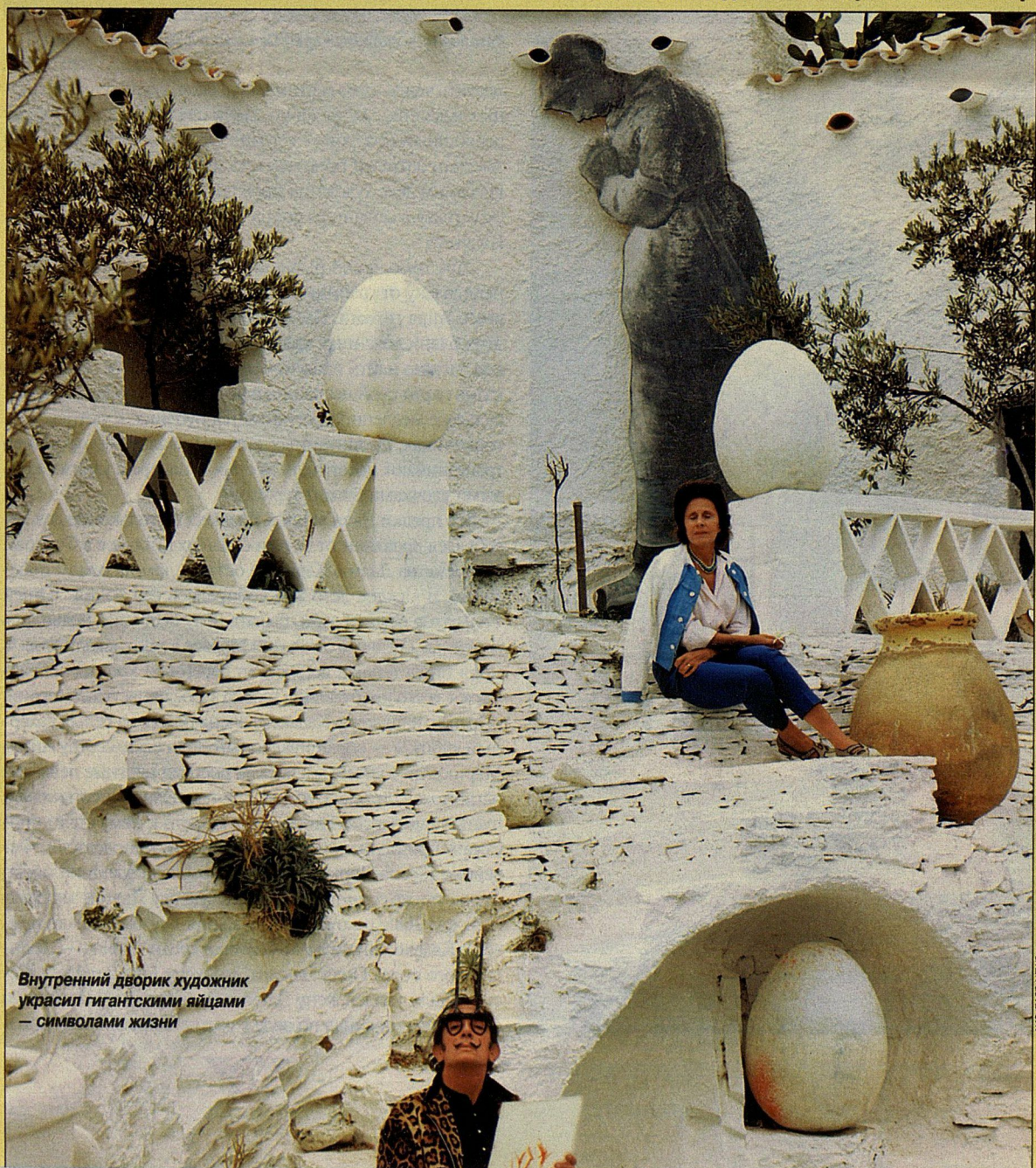
Внутренний дворик художник украсил гигантскими яйцами — символами жизни