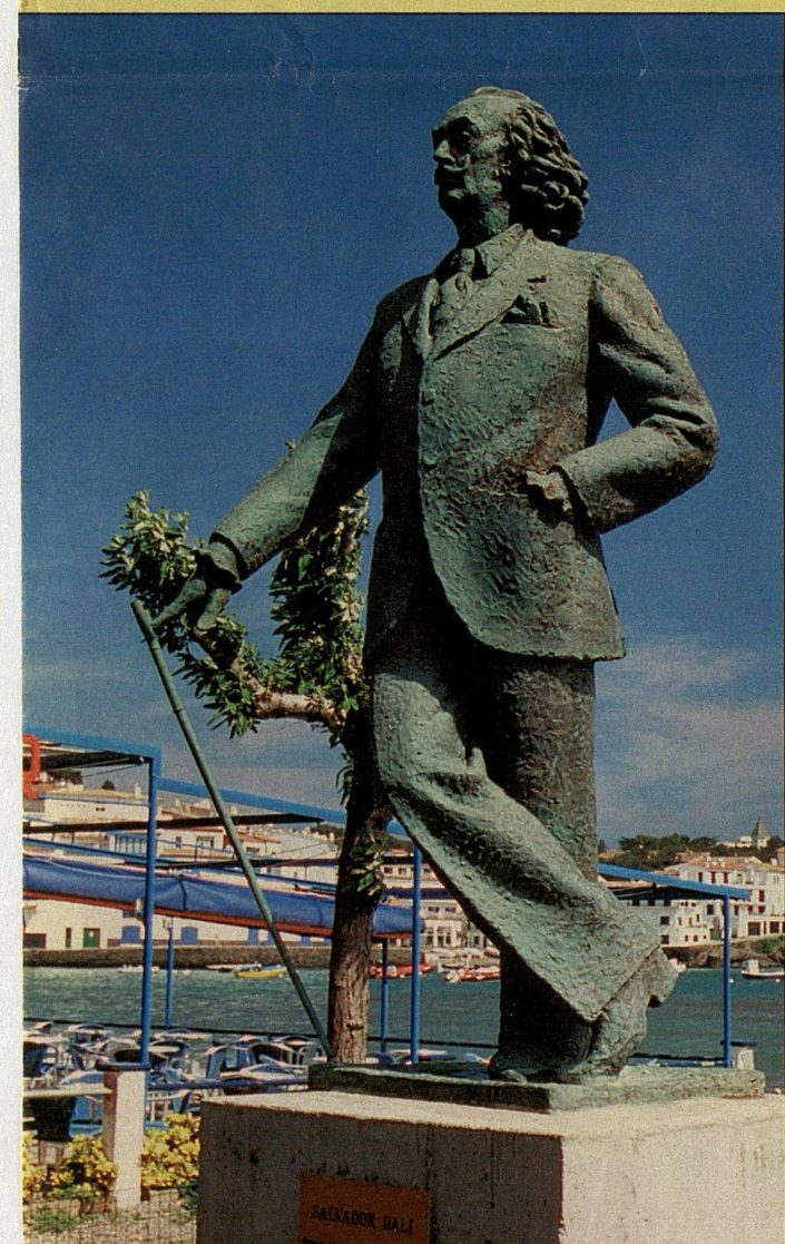
Памятник Дали в Кадакесе