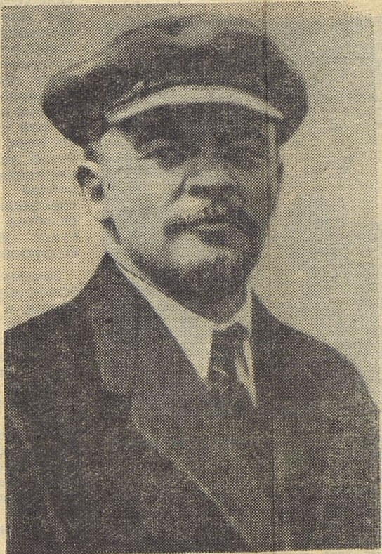
В. И. Ленин. Москва. 1 мая 1920 года.

ОСНОВОПОЛОЖНИКИ научного коммунизма доказали, что в антагонистическом обществе эстетическое освоение мира протекает в крайне противоречивых условиях, особенно неблагоприятных в эпоху владычества буржуазии, когда наслаждение красотой действительно недоступно подавляющему большинству трудящихся. Между тем стрем-