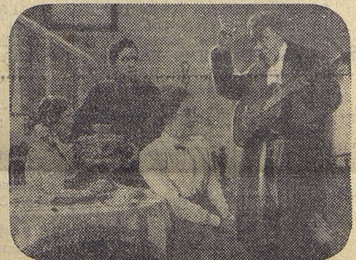
Кадр из фильма «Васса Железнова»