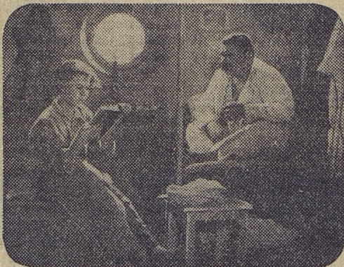
Кадр из фильма «В людях»