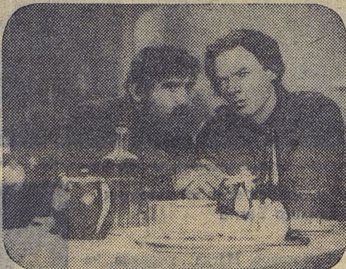
Кадр из фильма «Мои университеты»