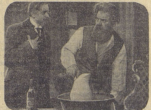
Кадр из фильма «Дело Артамоновых»